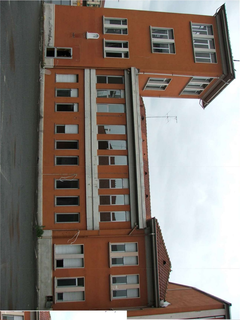
PALAZZINA (vista da cortile interno ex Comando VV.FF.)