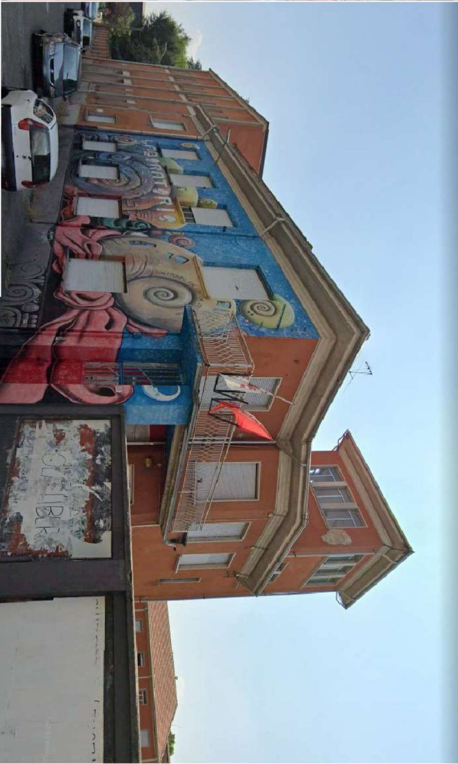
PALAZZINA (vista da Via Piave)