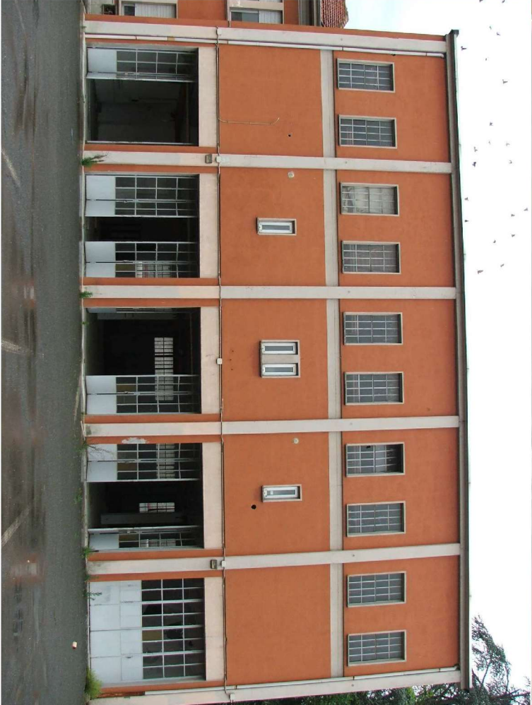
Corpo Magazzini + Palestra (vista da cortile interno)